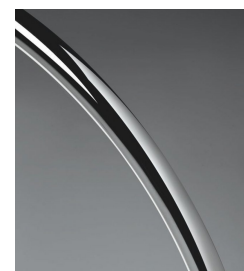
.31 Cromo - Chromed