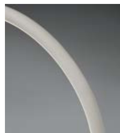
.01 Bianco - White