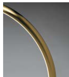
.25 Dorato satinato Satin gold