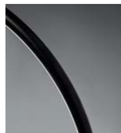
.02 Nero - Black