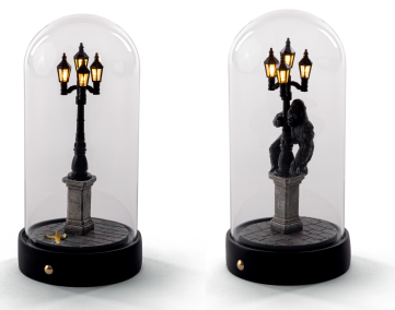
MY LITTLE CORNER_10466 MY LITTLE KONG_10465

本製品は、家庭ごみとして廃棄することはできません。本製品は、電気および電子機器に関する欧州指令 2012/19/EU (WEEE) に従って表示されています。この指令は、廃棄される電気電子機器の回収とリサイクルにおける規則を定めたもので、EU 圏内で有効です。廃棄される機器の回収については、本製品を使用する国で定められている廃品回収システムに従ってください。