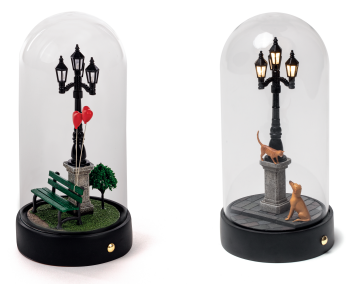
MY LITTLE VALENTINE_10469 MY LITTLE EVENING_10464